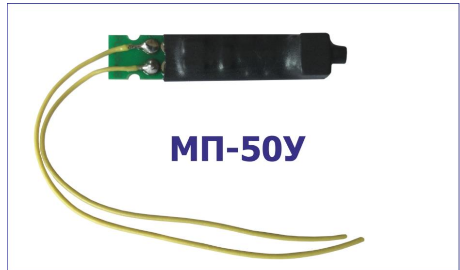
Высокочувствительный микрофон МП-50У